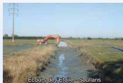
Écours de l'Étoile - Soullans