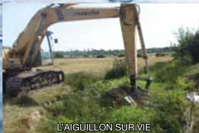
L'AIGUILLON SUR VIE

8 km – 29 890 m 3 de plantes extraits – 25 286 € HT