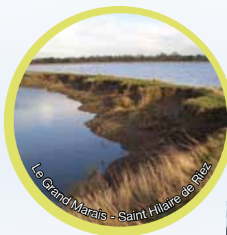
Le Grand Marais - Saint Hilaire de Riez