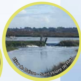
Etier de Baisse - Saint Hilaire de Riez