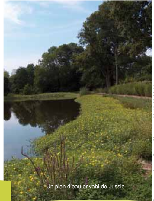
Un plan d'eau envahi de Jussie

Depuis 1997, le Syndicat Mixte des Marais met en place de nombreuses actions d'entretien sur les marais pour limiter leur développement (arrachage manuel et arrachage mécanique).