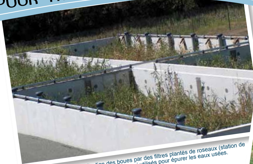
Déshydratation et minéralisation des boues par des filtres plantés de roseaux (station de la Vallée - Givrand). Ces systèmes sont aussi utilisés pour épurer les eaux usées.