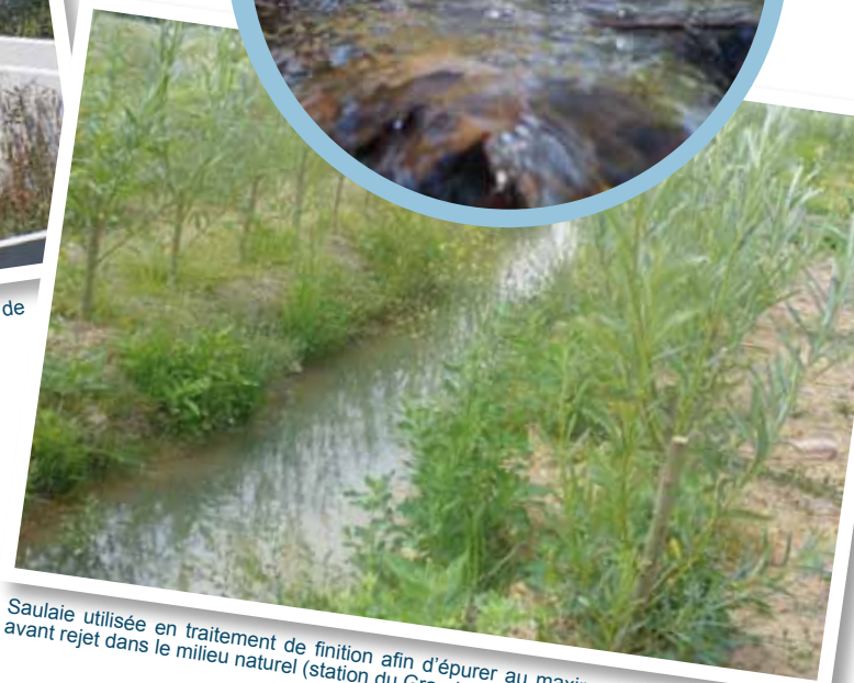
Saulaie utilisée en traitement de finition afin d'épurer au maximum les eaux avant rejet dans le milieu naturel (station du Grand Bois - Givrand).