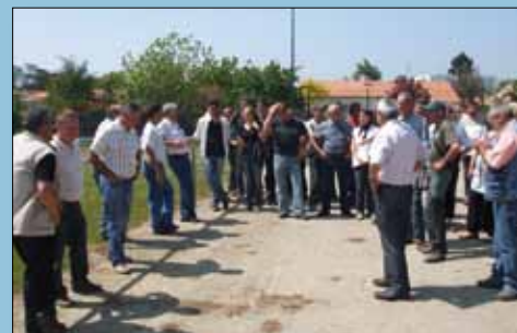
Visite de la commune de Rocheservière

Suite à la publication de l'arrêté préfectoral du 17 mars, le Syndicat Mixte des Marais de la Vie, du Ligneron et du Jaunay a organisé, dans le cadre du SAGE, une journée d'informations et d'échanges sur le thème du désherbage alternatif au désherbage chimique le 21 mai dernier au Golf des Fontenelles. Ce premier Forum a accueilli une soixantaine d'élus et d'agents des services espaces verts et voirie. Un remerciement particulier aux communes des Lucs-sur-Boulogne, de Brétignolles-sur-Mer et de Rocheservière qui ont accepté de témoigner de leurs pratiques de désherbage sans pesticides : paillage, tolérance et utilisation de la végétation spontanée, fleurissement des pieds de murs, balayage et binage, utilisation de désherbeurs thermiques... Les échanges ont été nombreux et intéressants... Une expérience à renouveler.