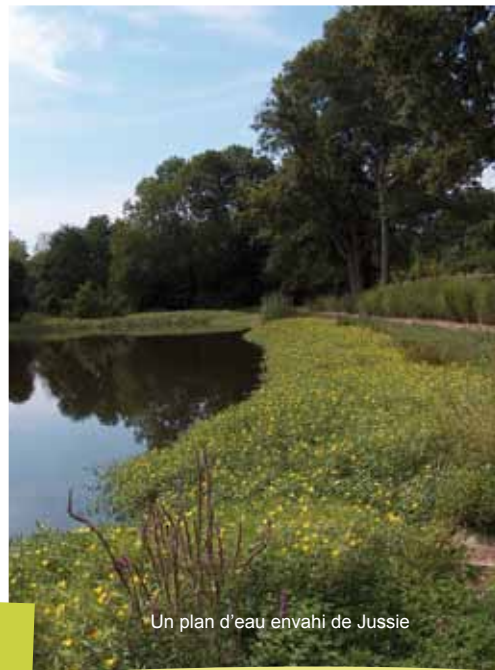
Un plan d'eau envahi de Jussie

Depuis 1997, le Syndicat Mixte des Marais met en place de nombreuses actions d'entretien sur les marais pour limiter leur développement (arrachage manuel et arrachage mécanique).