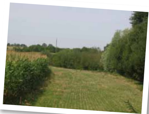
La bande enherbée, appelée également « zone tampon », permet de limiter les dérives directes dans le cours d'eau et d'épurer les eaux.

La réussite du programme nécessite l'implication de tous les agriculteurs mais aussi de toutes les structures qui les accompagnent. 100 % des agriculteurs des bassins versants sont concernés et sont contactés pour réaliser le DPA.